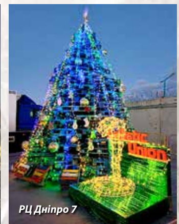
РЦ Дніпро 7