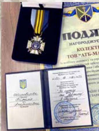
За всебічну допомогу та сприяння у підвищенні спроможнос-

Тож по фактичному завершенню третього року повномасштабної військової агресії економіка України за деякими ключовими параметрами виявилася значно здоровішою, ніж прогнозували.