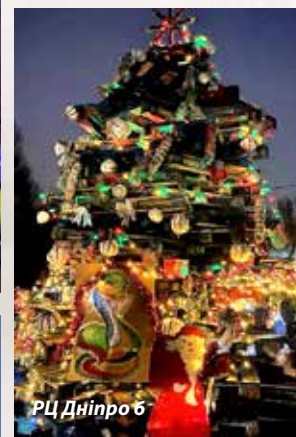
РЦ Дніпро 6