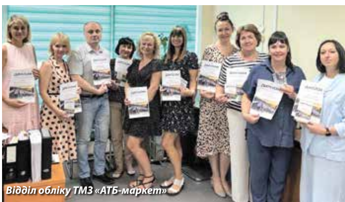
Відділ обліку ТМЗ «АТБ-маркет»