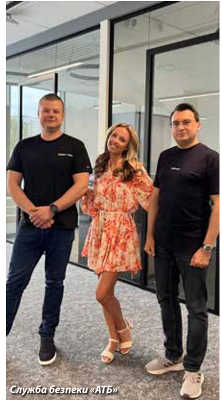
Служба безпеки «АТБ»