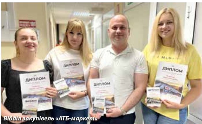
Відділ закупівель «АТБ-маркет»